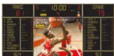
Tableaux de score avec écran LED

Afin de répondre aux différents besoins des clubs et collectivités, BODET propose une gamme complète composée de :