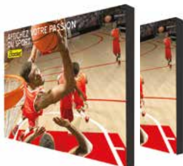
Ecrans LED :

Ils s'adaptent à de nombreux équipements sportifs : des écrans étanches pour les stades, des écrans avec traitement anticorrosion pour les patinoires et piscines, des écrans haute luminosité pour les gymnases et arénas.